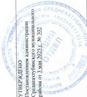
СХЕМА РАЗМЕЩЕНИЯ НЕСТАЦИОНАРНЫХ ТОРГОВЫХ ОБЪЕКТОВ НА ТЕРРИТОРИИ ГОРОДСКОГО ПОСЕЛЕНИЯ Г.КРАСНОСЛОБОДСК НА 2017-2026 ГОДЫ