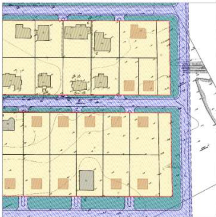
Чертеж планировки территории, М 1:500

"Корректировка проекта планировки и межевания территории земельного участка, расположенного по адресу: Волгоградская область, Среднеахтубинский район, примерно в 1,75 км по направлению на северо-запад от ориентира п. Песчанка, расположенного за пределами участка, в границах установленных планировочных кварталов №№ 21,22,23,24,25 с кадастровыми номерами 34-28-100028-3981, 34-28-100028-6797, 34-28-100028-6798, 34-28-100028-3967. Изменения, внесенные в проект, утвержденный Постановлением Администрации городского поселения г. Краснослободск от 15.03.2022 г. №125"